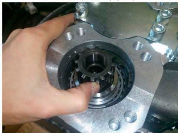
Установите на прежнее место стопорное кольцо и установите переходник, предварительно смазав шлицевое соединение литолом-24 (рис. 3)