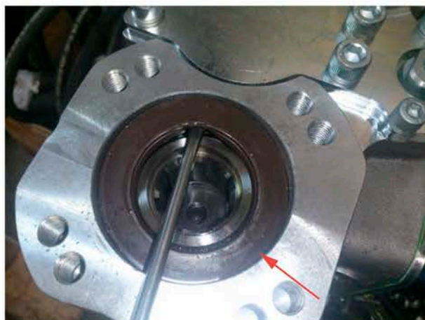
Снимите манжетное уплотнение (рис. 2)