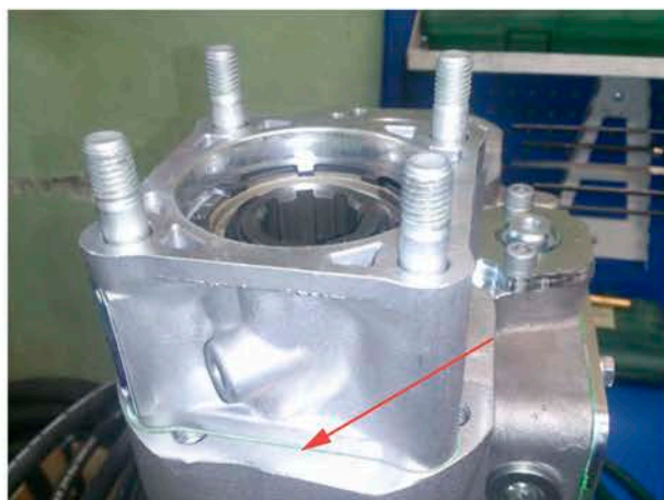
Закрутите шпильки из комплекта точки отбора мощности и установите точку отбора, не забыв подложить на посадочную поверхность паронитовую прокладку (рис. 6)

Чтобы закрепить переходник (рис. 4), ведущая шестерня КОМ должна быть заблокирована. Самый легкий способ заблокировать шестерню КОМ: оставить КОМ в зацеплении с коробкой передач на незаведенном автомобиле. В этом случае ведущая шестерня КОМа не будет прокручиваться и крепежный болт переходника затянется без проблем. Вторая паронитовая прокладка из комплекта устанавливается между точкой отбора мощности и насосом.