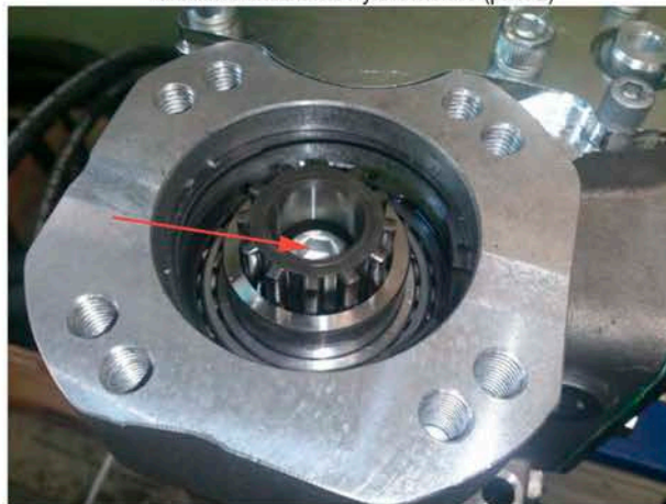
Через пружинную шайбу закрепите переходник на втулке ведомой шестерни КОМ с помощью болта из комплекта точки отбора мощности. Момент затяжки болта 80-90 Нм. (рис. 4)